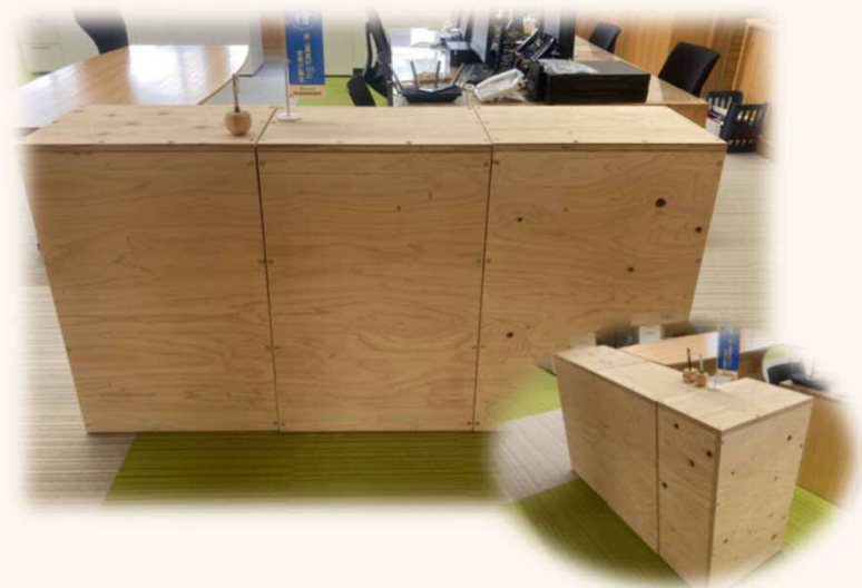
「受付カウンター」 3基で1セット 置き方でL字やI字型に！ 33,000円（税込）