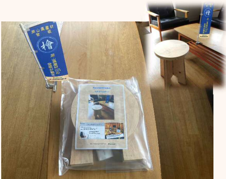
「丸椅子作成キット」 塗装、色塗り、あなた好みに 作成できます。 2,860円（税込）