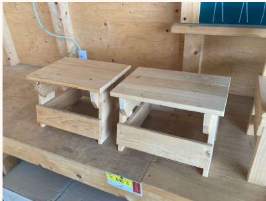
「踏み台」 ちょこんと踏み台 2,300円（税込）