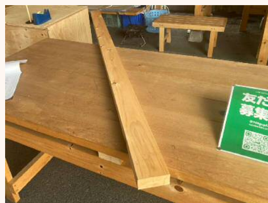
2m × 38mm × 89mm 630円（税込）