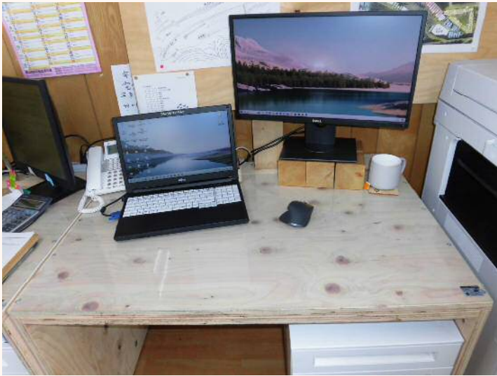
「合板デスク」 明るい雰囲気デスクです。 事務、作業、学習