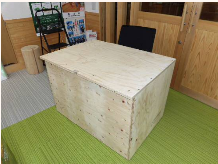
「合板デスク」 無研磨タイプ（作成キット） 13,200円（税込）