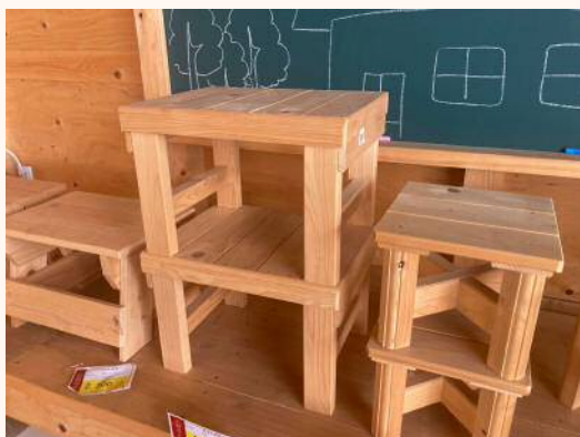
「ちょいがけ」 ちょっと腰かけよう 2,300円（税込）