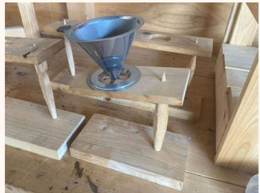
「コーヒードリッパー台」 3,000円（税込）