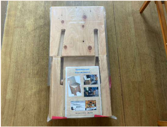
「背もたれ椅子作成キット」 5,390円（税込）