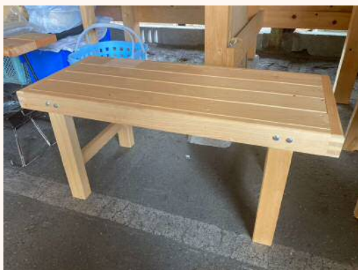
「縁台」 お庭のお椅子に 3,850円（税込）