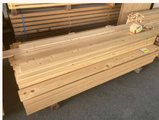
2m × 19mm × 120mm 420円（税込）