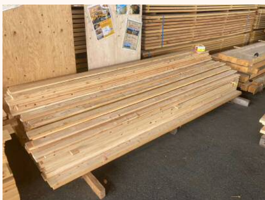
3m × 19mm × 89mm 460円（税込）