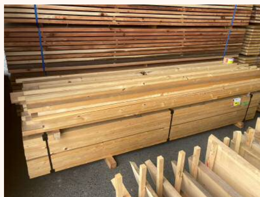
3m × 38mm × 89mm 940円（税込）