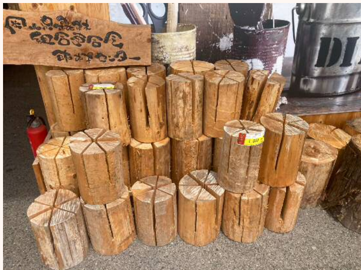
「スウェーデントーチ」 よく乾いてます！ 1,000円（税込）