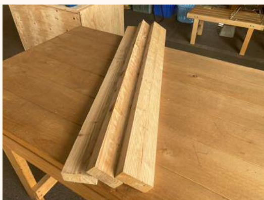
1m × 38mm × 89mm 320円（税込）