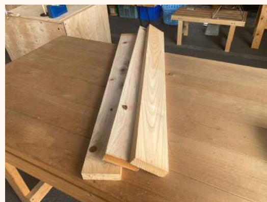
1m × 30mm × 105mm 330円（税込）