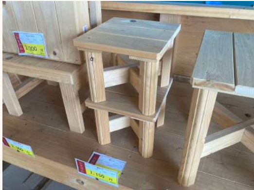
「角ミニ」 足場、小物置き、用途色々！ 1,150円（税込）