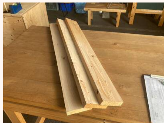
1m × 30mm × 120mm 380円（税込）