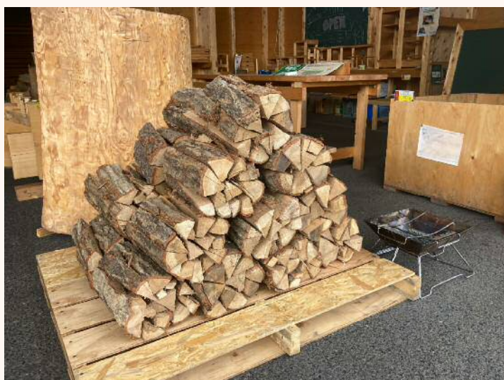
「広葉樹薪」 長さ30cm×径20cm程度 の原木を10数本に 割り束ねています。 700円（税込）