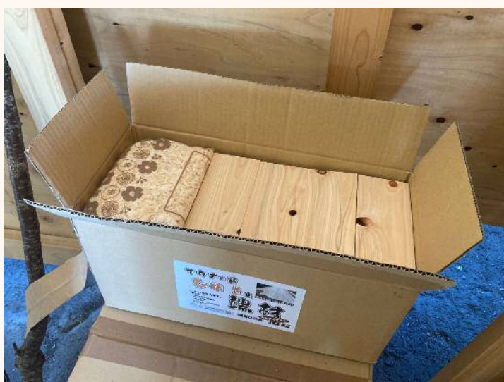
「薪箱」 桧の薪です。 製材端材を活用！ 2,235円（税込）