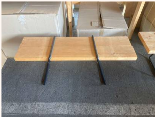
「マルチレッグ」 ※板材は別売り 板材がベンチに早変わり 2,500円（税込）