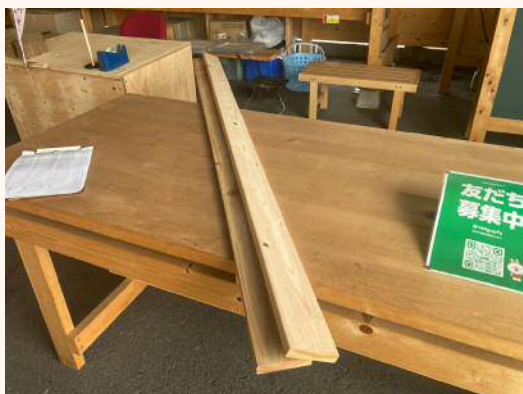
2m × 19mm × 89mm 320円（税込）