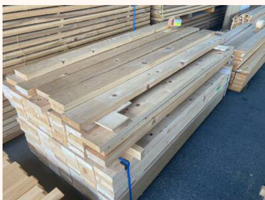
2m × 38mm × 140mm 1,110円（税込）