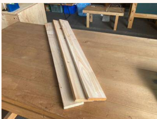
1m × 19mm × 89mm 150円（税込）