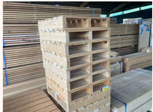
「ヒノキパレット小」 2,530円（税込）