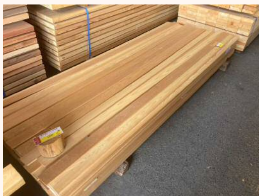
2.5m × 10mm × 75mm 無地 560円（税込）