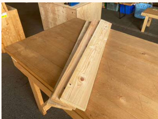
1m × 19mm × 120mm 230円（税込）