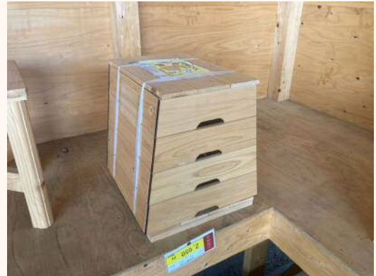
「とびばこくん」 おもちゃ、野菜、小物入れ 2,650円（税込）