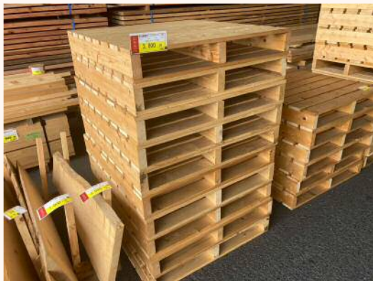
「ヒノキパレット大」 3,800円（税込）